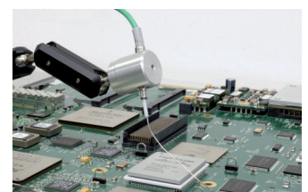
* Abbildung/Figure 5: AccuTC Sensor/ AccuTC sensor