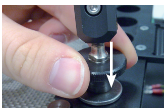
Abbildung/Figure 2 & 3: Montage des Flexpoint am Leiterplattenhalter/ Mounting of Flexpoint on PCB holder

The Flexpoint TC-holder can heat up during the rework process!