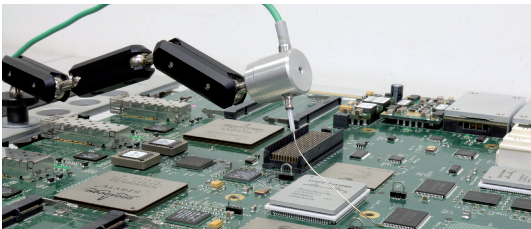
Abbildung/Figure 6: Flexpoint und AccuTC an IR 650 A / Flexpoint and AccuTC on IR 650 A

Änderungen vorbehalten/Subject to change