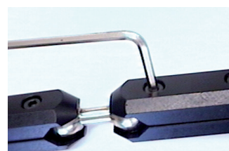
Abbildung/Figure 4: Einstellung der Biegsamkeit/ Adjusting the holders flexibility